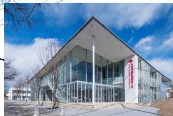
道路側から見える5号館の様子